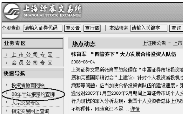
图3-10 上交所网站的“预约查询”功能

在上海证券交易所、深圳证券交易所网站的首页，看到定期报告预约查询的栏目（图3-10）。通过这个栏目，投资者可以在披露开始前，方便地查询哪一家上市公司会在哪一天披露定期报告。一般来说，很少有公司会变动预约时间，如果变动，交易所网站也会马上进行相应变更（见表3-1）。