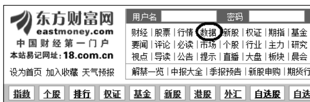
图3-15 东方财富网页面

该网站首页中有数据栏目（见图3-15），进入该栏目后，是该网站数据频道。这个频道将上市公司的各种业绩预告、业绩快报进行了很好的整理，很便于投资者快速浏览（见图3-16）。