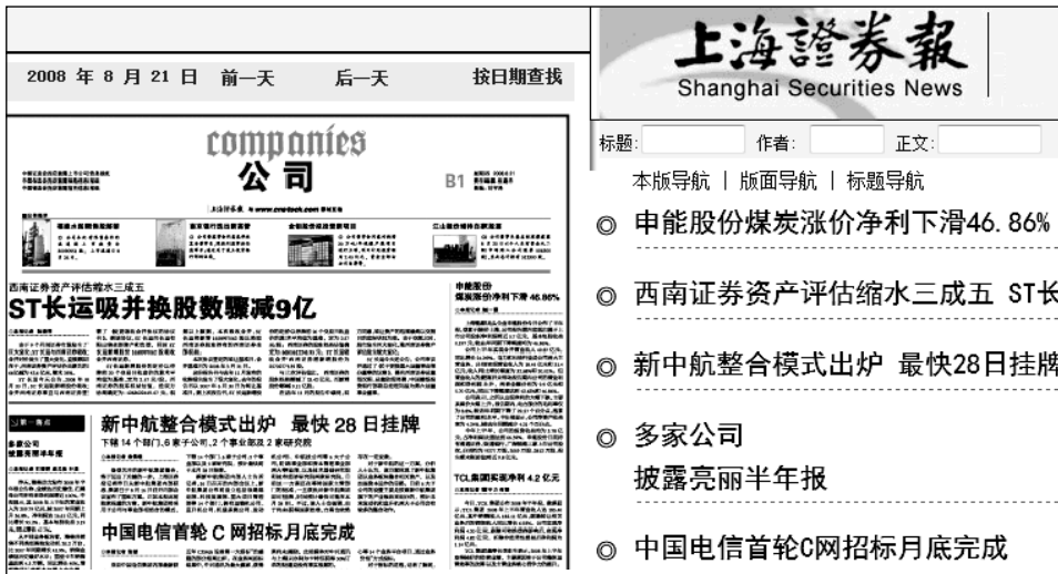
图3-17 《上海证券报》电子版

这些报纸会在前一天晚上把值得关注的公告做成新闻或摘要，这样投资者浏览或查询时就很方便。应该说，三家报纸关注的基本内容是一致的，但每天的侧重点会有所不同，对每一条新闻的处理也会有区别。投资者如果时间充裕，不妨都看一下。