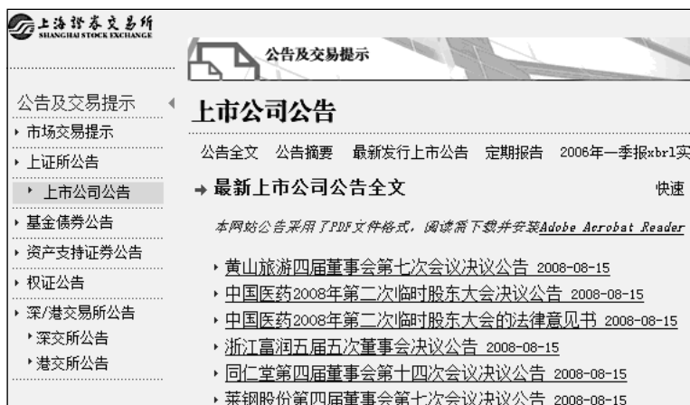
图3-9 上交所提前刊出上市公司最新公告

因此，投资者如有可能，最好每天晚上10点钟以后（此时绝大多数公告已经上网），抽出几分钟时间，上网看一看自己所关注的上市公司，有没有最新公告。若放到第二天早上看，如遇到披露一些重大事项，公告内容会很多，很可能来不及仔细分析。