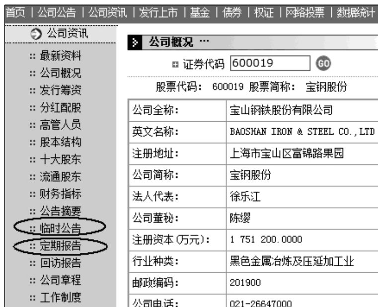
图2-4 上市公司信息页面

该页面中，投资者最常用的，是“临时公告”栏目，以及“定期报告”栏目。前者显示上市公司最近几年中，所有的公告原文；而后者则涵盖了上市公司近几年披露过的年报、半年报以及季报。